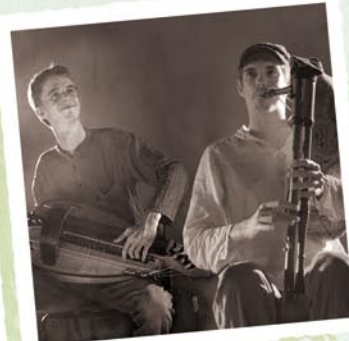
FACE À PHASMES

LE PLANCHER TREMBLE , musique du Limousin. Quinze musiciens pour assurer en acoustique la continuité du bal.